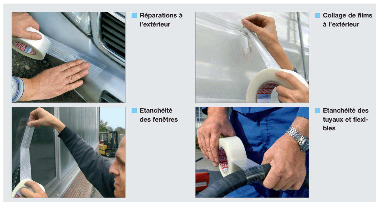
■ Réparations à l'extérieur