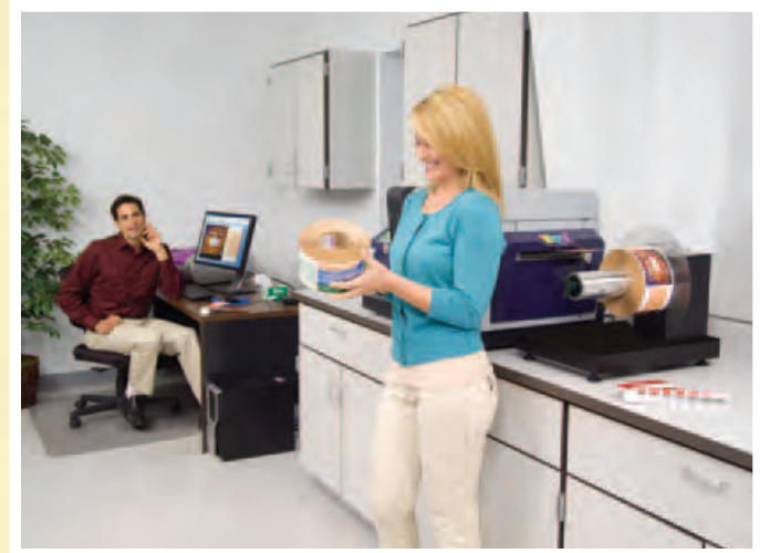
Mit dem Vivo! Touch kehrt QuickLabel zu seinen Wurzeln zurück, der Entwicklung intelligenter Etikettendrucker

Das Handling von Druckdateien mit vielen grafischen Elementen bei gleichzeitigem Verarbeiten und Drucken variabler Informationen aus Datenbanken verursachen beim Vivo! Touch keine Verzögerungen zwischen Etiketten. Beim Vivo! Touch gibt es keinen Kompromiss zwischen Druckqualität und Intelligenz: Er druckt vollfarbige Etiketten in hoher Auflösung und hoher Geschwindigkeit.