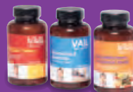
Etiketten für Ernährungszusätze