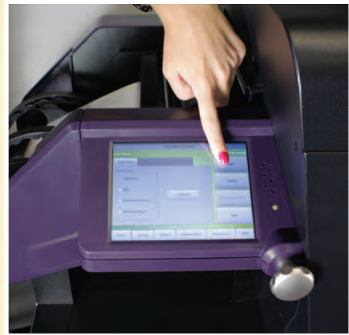
Farbetiketten drucken Sie direkt über den Touchscreen-Monitor des Vivo! Touch

Dank seines Stand-alone-Druckmodus TouchPrint™ ist es unnötig, Ihren Vivo! Touch an einen Computer anzuschließen. Sie gehen einfach zum Vivo! Touch und laden Ihre Etikettendateien von einem USB-Stick. Oder Sie laden Etikettendateien über eine USB- oder Ethernet-Verbindung auf den Etikettendrucker und trennen ihn dann von Ihrem Computer oder Computernetz. Welchen Weg Sie auch wählen, jetzt sind Sie bereit, vollfarbige Etiketten ohne Computer zu drucken. Jede Etikettendatei kann im eingebauten Speicher des Vivo! Touch aufbewahrt werden. Außerdem können Benutzer vor dem Drucken ein kleines Vorschaubild jedes Etiketts ansehen, um zu prüfen, ob sie die richtige Datei gewählt haben.