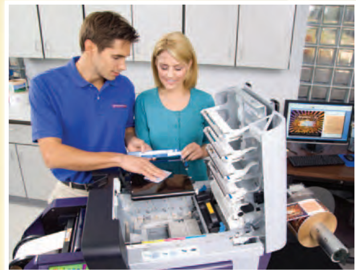
Ein von QuickLabel geschulter Fachmann installiert Ihren Vivo! Touch persönlich und bleibt bei Ihnen, bis alles funktioniert und Sie Ihre Etiketten selbst drucken können

Der Vivo! Touch besitzt eine zweijährige Garantie – eine ungewöhnlich lange Garantiedauer für den B2B Bereich. Wir bieten sie Ihnen, weil wir wissen, dass Ihre Entscheidung für den Druck Ihrer Etiketten im Haus bedeutet, dass Sie die Funktion der Etikettierung Ihrer Produkte selbst übernommen haben und keine ungeplanten Ausfallzeiten akzeptieren können.