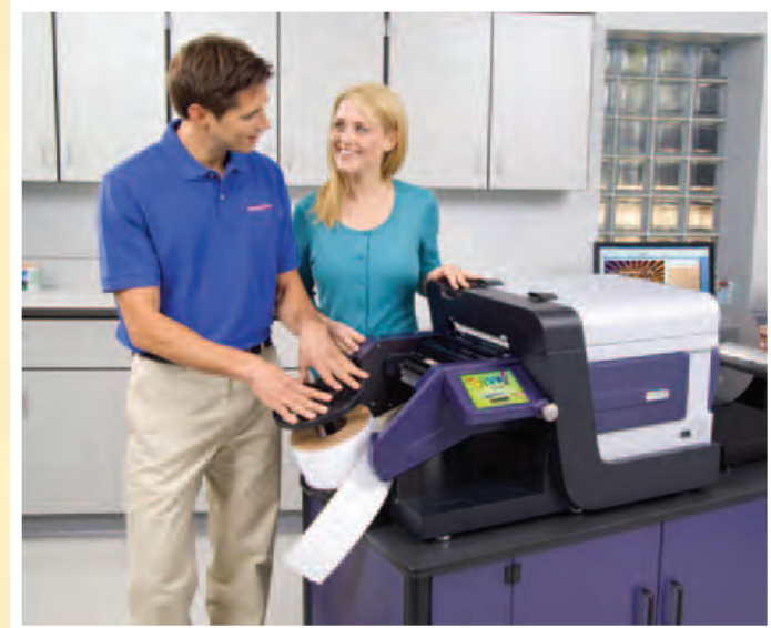
Der „Dritte Hand“-Mechanismus macht es einfach, den Vivo! Touch mit einer Rolle Blankoetiketten zu bestücken

Deshalb besitzt der neue Vivo! Touch eine „dritte Hand“. Sie besteht aus einem Träger und einer integrierten Spindel, um Ihre Blankoetikettenrolle zu halten. Diese „dritte Hand“ zentriert die Etikettenrolle automatisch und hält sie auf der Spindel, sodass sie klar perfekt sitzt, um problemlos in den Drucker zu laufen. Jetzt müssen Sie das Etikettenmaterial nur noch mit den Fingern nach vorn schieben, bis der Drucker es greift. Dann drücken Sie „Laden“ auf dem Sensorbildschirm.